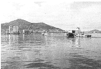
■函館港西防波堤建設その他工事 (佐々木誠) ＝函館開建発注＝