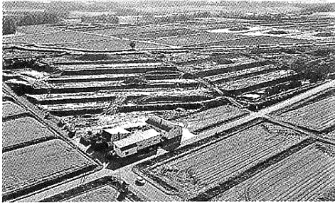
■旭東東神楽地区75農区外区画整理工事 (瀬日出海) ＝旭川開建発注＝