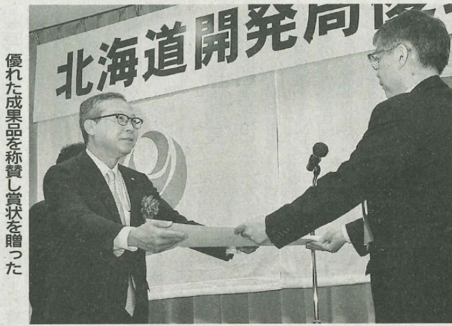
優れた成果を称賛し賞状を贈った

北海道開発局は26日、2023年度優良工事等局長表彰式を札幌第一合同庁舎で開いた。局長賞を受賞した工事31社、業務36社の代表と技術者に、柿崎恒美局長が表彰状を授与。生産性向上や脱炭素に取り組んだ高品質の工事、新たな手法提案などの創意工夫あふれる業務を遂行した各社とその技術者をたたえた。 22年度に完成した工事1409件、業務2391件を対象として、特に大きな成果を上げた工事30件、業務41件を選出。生産性向上で優れた成果を上げたり、担い手確保や二酸化炭素の削減に取り組んだ工事を多数選んだ。