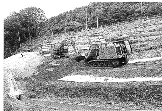
■一般国道227号北斗市外中山改良工事 (大高延之) ＝函館開建発注＝

潮位・風速のリアルタイム観測環境構築などの安全対策に万全を期し、浚渫土改良と材料搬出岸壁において、岸壁と土運船の空間をシート養生する環境対策を実施。防波堤上部工では、プレキャスト部材を活用する創意工夫により、施工中の防波堤機能喪失期間を短縮し、本体工の損傷リスク低減を図った。